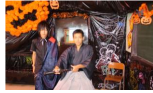
ハロウィンの世界を 見事に再現(?)