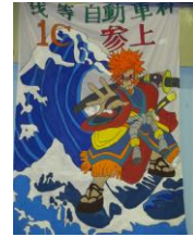
クラス旗も、どれも すばらしい出来ばえ