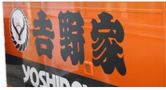
牛井の吉野屋様がキッチンカー を派遣してくださいました