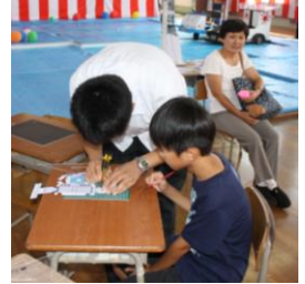
自動車部の展示は、 子供に大人気