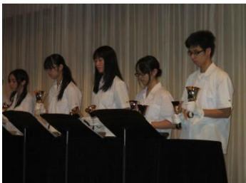
ハンドベル、合唱などのステージ発表も充実。生徒による ヨーヨーパフォーマンスはプロ級の腕前で大歓声が上がりました。