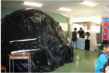
手作りプラネタリウム 見やすさを考えた半球ドーム構造

8月31日(土)に行われた一高祭一般公開では、予想を超える入場者数を記録し、盛況のうちに幕を閉じました。猛暑の中、ご来場下さった方々に心から御礼申し上げます。