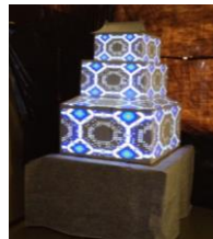
ミニ鶴ヶ城プロジェクションマッピングでは、音楽にあわせて様々な映像が 映し出され、会津の歴史と未来に思いをはせる構成となっていました