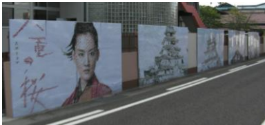
巨大モザイク壁画は市民の 方々の目を惹きつけました