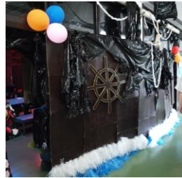
教室が丸ごと 海賊船こ!