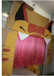
ネコバスの口から入ると 森が広がっています