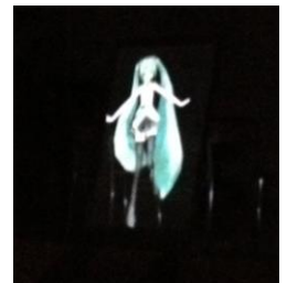
初音ミクが投影されているのは、なんと網戸! 暗闇で、ミクが歌い踊ります