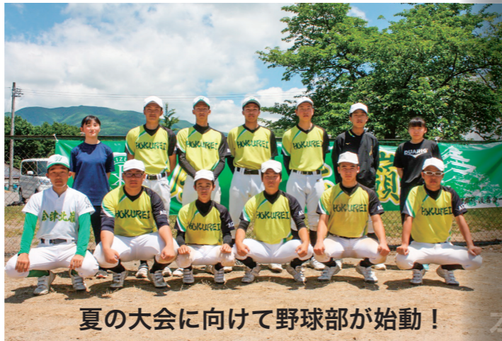
夏の大会に向けて野球部が始動!

「福島2020夏季高校野球大会」に向けて、野球部が本格的に活動を始めました。自粛期間中はメンタルトレーニングや戦略の検討といった課題をオンラインで行い、各部門も毎日素振りをするなどして再開への準備を進めてきました。野球部の活動再開については6月13日のスポーツニッポンでも大きく取り上げられ、「夏の優勝を勝ち取るために全力を尽くしたい」と主将もコメントを寄せていました。詳しくは会津北嶺高等学校野球部ブログ(下記)をご覧ください。