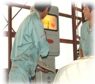
「サイド・スリップOK！」