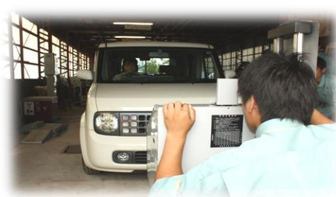
「対向車を考慮して角度を調整」