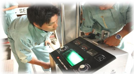
「これで正対出ているかな」